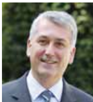
Pierre-Christophe Baguet Député-maire de Boulogne-Billancourt

Parce que les loisirs font partie intégrante de l'Éducation et que les vacances sont un moment privilégié pour vivre de nouvelles expériences, la ville propose chaque année aux jeunes Boulonnais un choix de séjours variés, tant en terme de destinations qu'en terme d'activités.